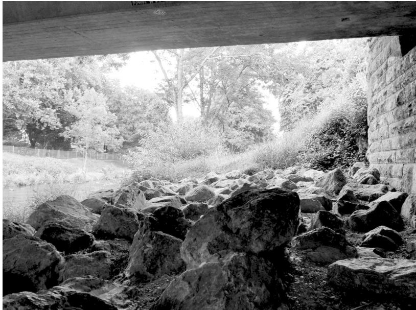
Steine im Weg: unter der Oberaubrücke

Vor allem der freie Wohnungsmarkt ist in Freiburg keine Alternative. Die hohen Wohnungspreise machen es für Wohnungslose fast unmöglich, die eigenen vier Wände auf dem freien Mietmarkt zu ergattern. Aber auch die Notunterkunft - so lautet die Einschätzung von verschiedenen Seiten - ist für junge Wohnungslose keine gute Alternative. Das Team in